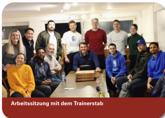
Arbeitssitzung mit dem Trainerstab