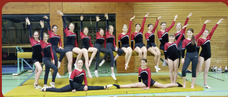
Unsere Turnerinnen 10–18!