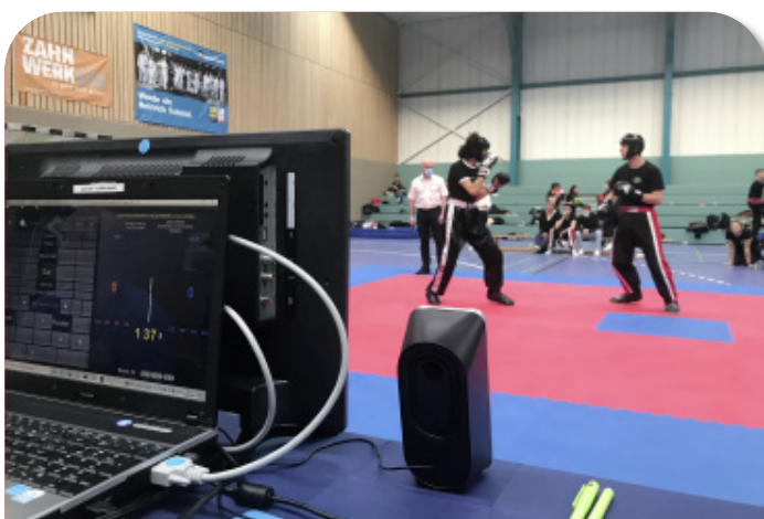
Der Blick vom Kampfrichtertisch