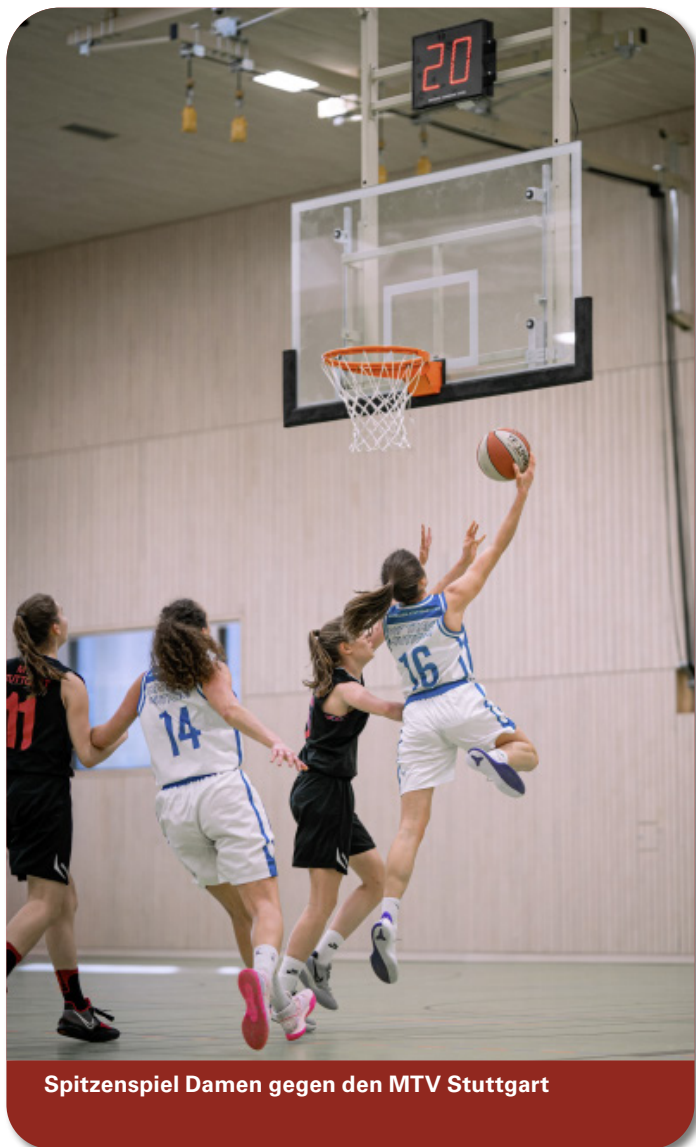
Spitzenspiel Damen gegen den MTV Stuttgart