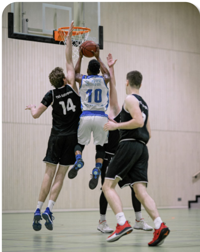
Herren 1 gegen den Tabellenführer Söflingen

„Ich gratuliere dem Coach und dem gesamten Team zu diesem tollen Erfolg. Es war eine bis dato nicht einfache Saison mit einigen