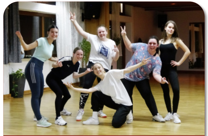
Aufbruch auch bei den HipHop-Mädels