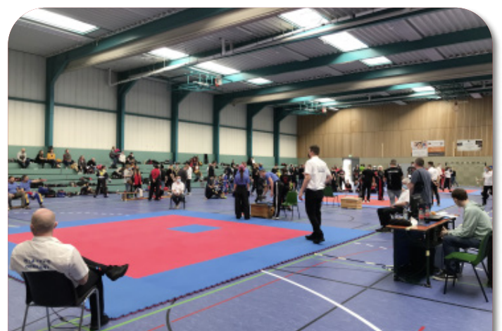
Die Baden-Württembergische Meisterschaft in der Ruth-Endress-Halle