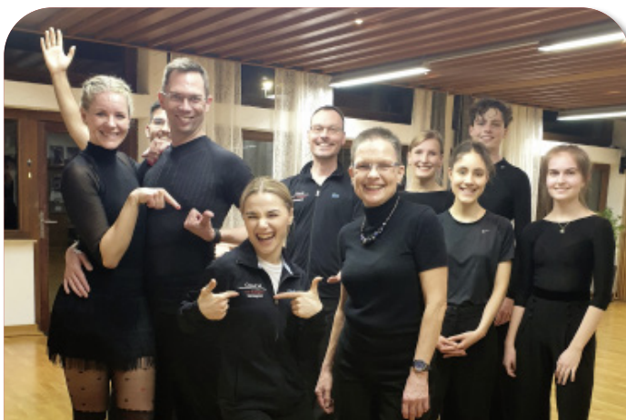
Neue tus Jacke – Ich bin hier der Coach